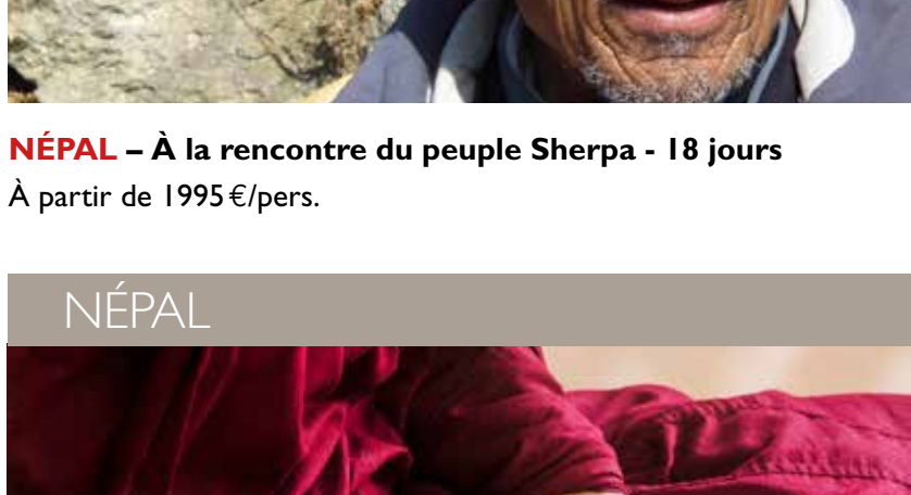
NÉPAL – Méditation et Mandala en pays Solu - 15 jours À partir de 1895 €/pers.