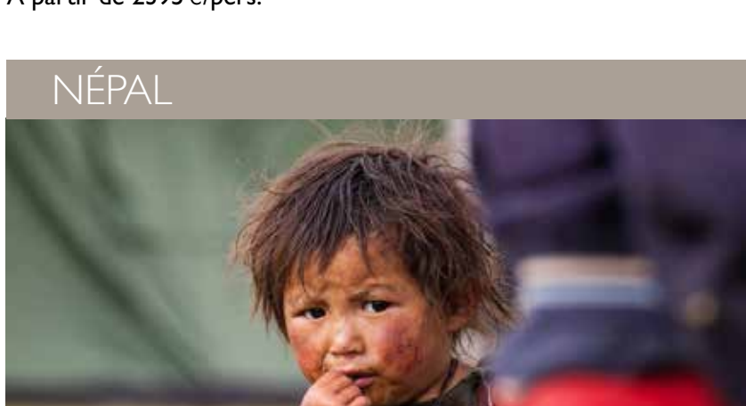
NÉPAL – Bas Dolpo - 21 jours À partir de 3395 €/pers.