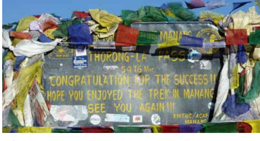
NÉPAL – Grand tour des Annapurnas - 23 jours À partir de 2295 €/pers.