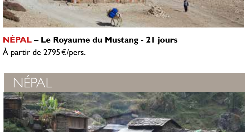
NÉPAL – Découverte et culture en pays Gurung - 15 jours À partir de 1795 €/pers.