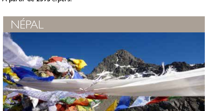
NÉPAL – Les lacs sacrés de Gosainkund - 14 jours À partir de 1795 €/pers.