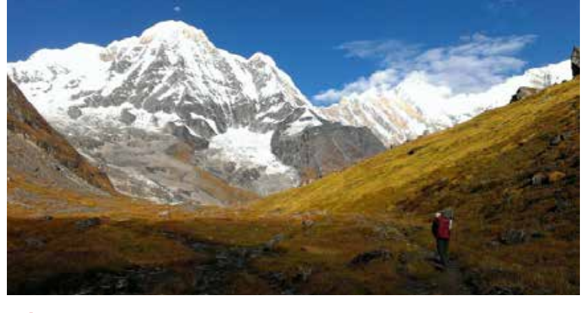
NÉPAL – Sanctuaire des Annapurnas - 17 jours À partir de 1795 €/pers.