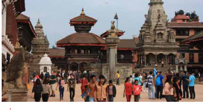
NÉPAL – Ascension du Chulu Peak - 24 jours À partir de 3395 €/pers.