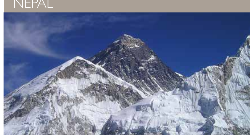
NÉPAL – Camp de base de l'Everest et Kala Pattar - 16 jours À partir de 2095 €/pers.