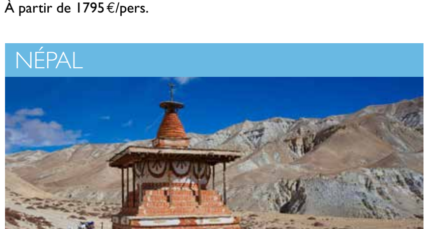
NÉPAL – Le Royaume du Mustang - 21 jours À partir de 2795 €/pers.