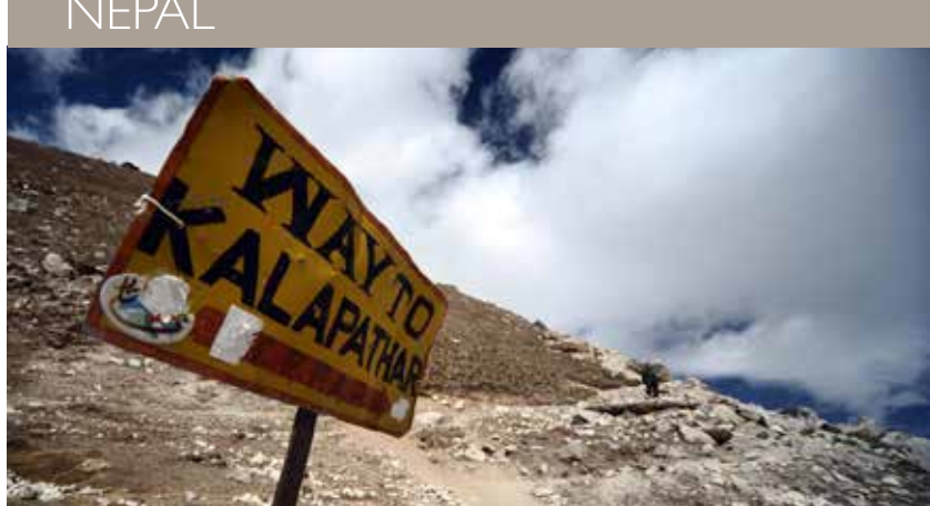
NÉPAL – Lacs Gokyo, Cho La et Kala Pattar - 20 jours À partir de 2095 €/pers.