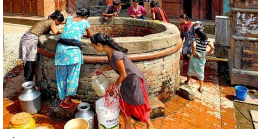
NÉPAL – Découverte du Népal - 17 jours À partir de 1995 €/pers.